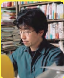
小宮山民人 (こみやま・たみひと)

1951年生まれ。美術・絵本評論家、作家、絵本学会会長、ちひろ美術館常任顧問。1977年にちひろ美術館・東京、97年に安曇野ちひろ美術館を設立。同館館長、長野県信濃美術館・東山魁夷館館長を歴任。著書『安曇野ちひろ美術館をつくったわけ』(新日本出版社)、『東山魁夷と旅するドイツ・オーストリア』(日経新聞出版社)、『母ちひろのめぐもり』、絵本に『白い馬』、『りんご畑の12か月』(いずれも講談社)など。